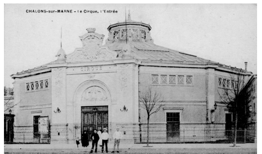
CHALONS-SUR-MARNE - Le Cirque. - l'Entrée