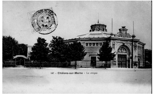
147 - Châlons-sur-Marne - Le cirque

LE CNAC , quant à lui, est le résultat direct de cette volonté de préserver et de transmettre l'art du cirque, prouvant que la magie de l'enseignement peut cohabiter avec le respect du patrimoine. Le Cirque de Châlons, avec ses coursives où résonnent encore les échos du passé, est un phare qui illumine l'avenir du cirque français. C'est ainsi que ce lieu emblématique, témoignant de la richesse historique et architecturale de Châlons-en-Champagne, continue de féconder l'univers circassien, prouvant que l'on peut à la fois honorer les traditions et nourrir les révolutions artistiques.