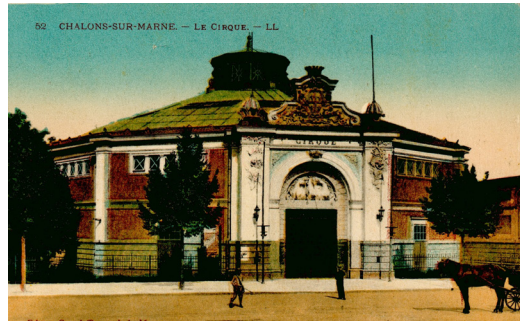
52 CHALONS-SUR-MARNE - Le Cirque. - LL